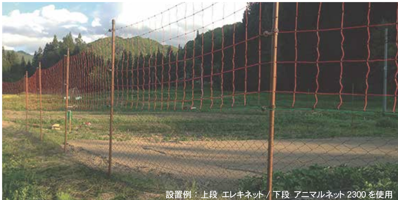
設置例：上段 エレキネット / 下段 アニマルネット 2300 を使用